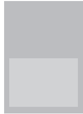
1/2 Seite quer