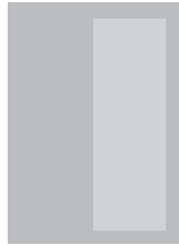
1/2 Seite hoch