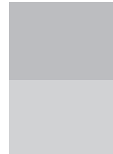
1/2 Seite quer